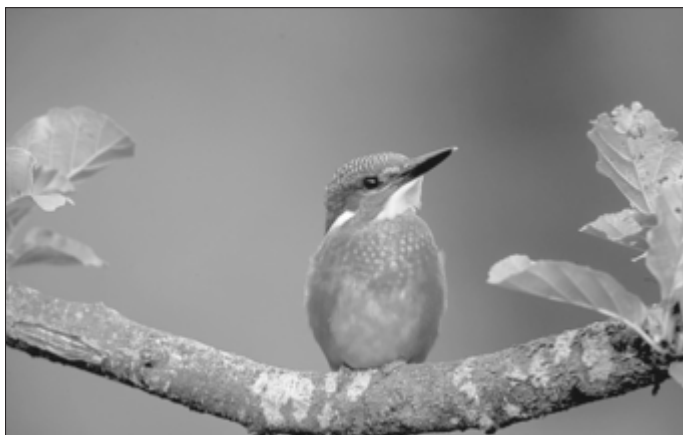
Stellvertretend für alle Arten im Günztal ziert ein kleiner Wasservogel das Jubiläums-Logo der Naturschutzstiftung.

Im Arbeitsfeld Landwirtschaft geht es um insektenfreundliche Bewirtschaftungsmethoden im Grünland, wie z. B. der Einsatz moderner Doppelmessermäherwerke. Mit einem Fitness-Check Biotopverbund wird die Funktion der Biotopvernetzung im Günzgebiet von den Universitäten Halle und Osnabrück wissenschaftlich untersucht. Eine begleitende Öffentlichkeits- und Umweltbildungsarbeit zielt darauf ab, das gesellschaftliche Bewusstsein für die Insekten-Biodiversität zu fördern und Handlungsmöglichkeiten aufzuzeigen.